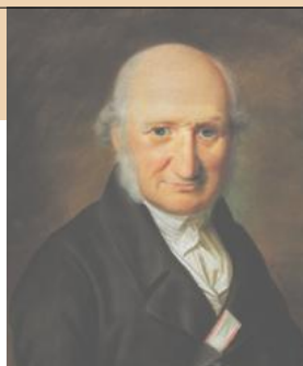
Begynnelsen: Niels Treschow ble den første professoren, i filosofi, ved det nye universitetet i Christiania.